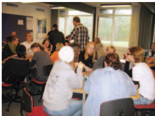
Torsdagscafé med studiepraktikanterne.

I tre dage sidst i oktober måned væltede det bogstaveligt talt ind med 40 studiepraktikanter på Diakonhøjskolen. De var nogenlunde ligeligt fordelt på både diakonpædagoguddannelsen og professionsbachelor i Kristendom, Kultur og Kommunikation, populært også kaldet 3K-uddannelsen. Unge fra hele landet kan traditionen tro i uge 43 komme i studiepraktik på de videregående uddannelser; men det er første gang, at Diakonhøjskolen har oplevet så stor en tilslutning til arrangementet, hvilket jo er utrolig glædeligt. Nogle af studiepraktikanterne kom endda langsejts fra for at se på drømmestudiet. Diakonhøjskolen havde besøgende helt fra Sjælland, Fyn og Vest- og Nordjylland. I 2 dage kunne studiepraktikanterne få en smagsprøve på undervisningen og få et indblik i skolens særlige studiemiljø, højskolemiljøet. Dét, at skolen tilbyder dens studerende så meget klasseundervisning i løbet af studierne, oplevede studiepraktikanterne som noget særligt positivt på Diakonhøjskolen.