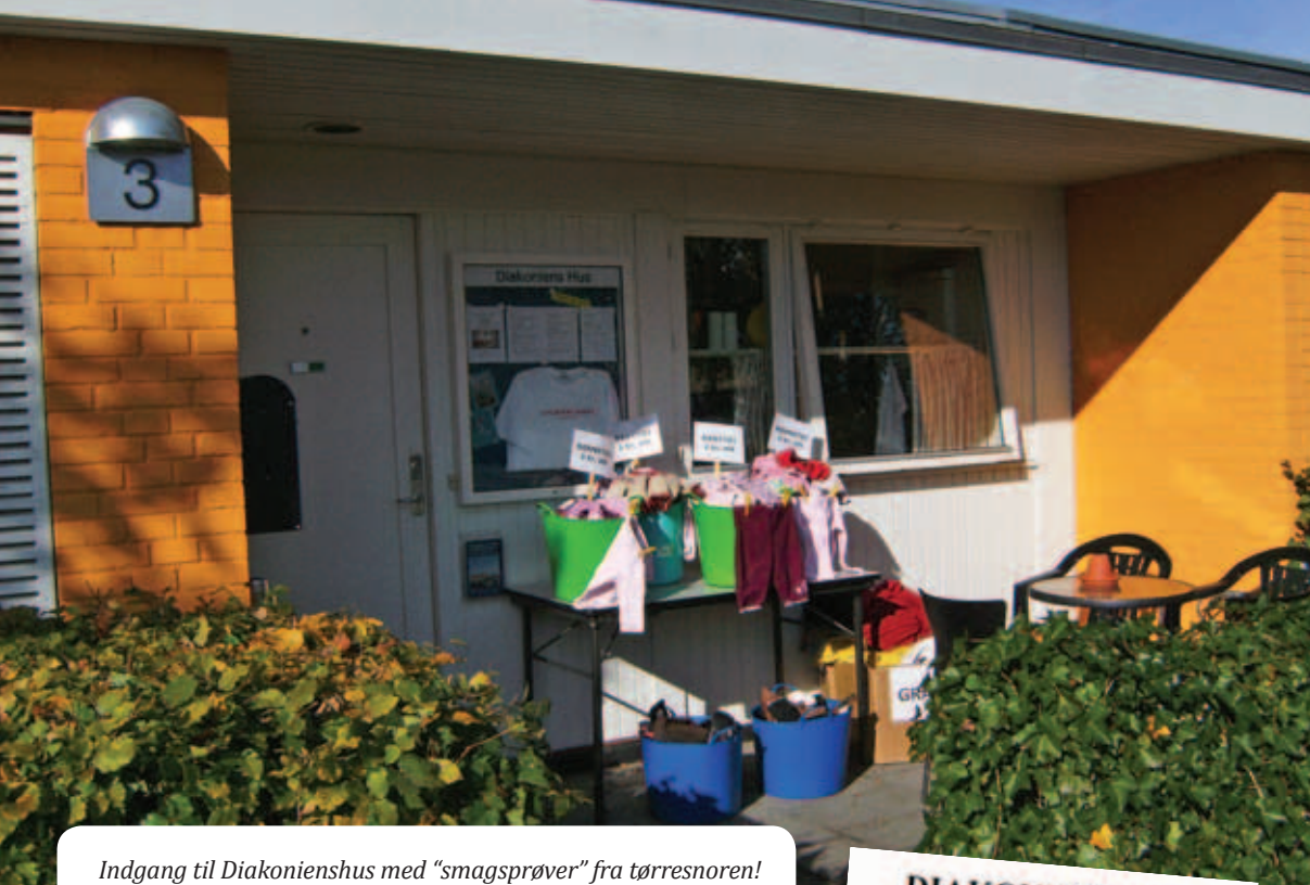
Indgang til Diakonienshus med "smagsprøver" fra tørresnoren!

sker fra området, på den måde får lyst til at være kirke for hinanden.